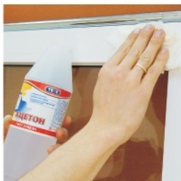
9. Обработать вертикальные штапики специальным раствором (ацетон, спирт).