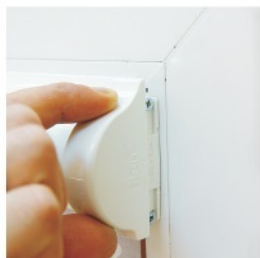
7. Прикрепить боковые крышки карниза. Проверить работу механизма.