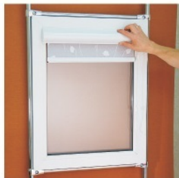
3. Приложить изделие к окну.