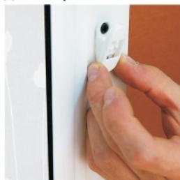
8. Высверлить отверстия сверлом диаметром 2 мм под фиксатор цепочки, установить фиксатор цепочки.