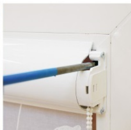
6. Прислонить короб к раме и укрепить саморезами (клопы 9 мм).