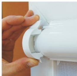
2. Снять боковые крышки карниза.