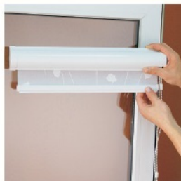
1. Распаковать изделие.